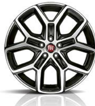
1M6 Aluminijumska CROSS DIAMOND felna 17"

Kompanija "FCA SRBIJA" d.o.o. zadržava pravo izmene cena bez prethodne najave.