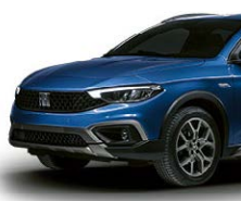
405 Plava "Oceano"