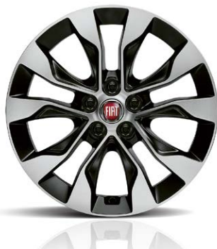
1M4 Aluminijumska felna 16"