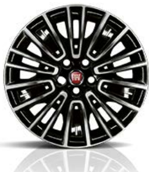
2XR Stilizovana felna 16"