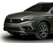
695 Tamno siva