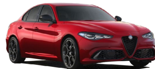
645 Etna crvena