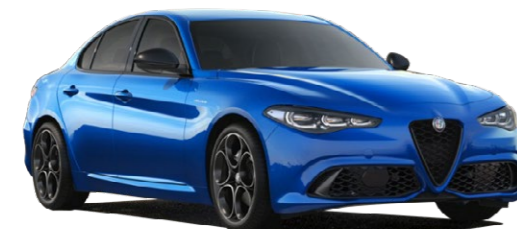
756 Misano plava