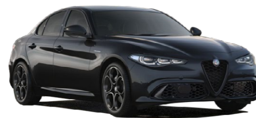
408 Vulcano crna