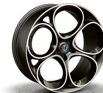
3CX Alu felne 19"