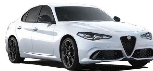
217 Alfa bela