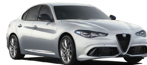
52 Moonlight perla bela