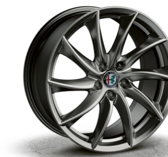
3CO Alu felne 18"