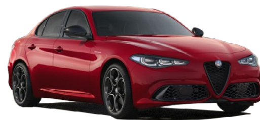
414 Alfa crvena